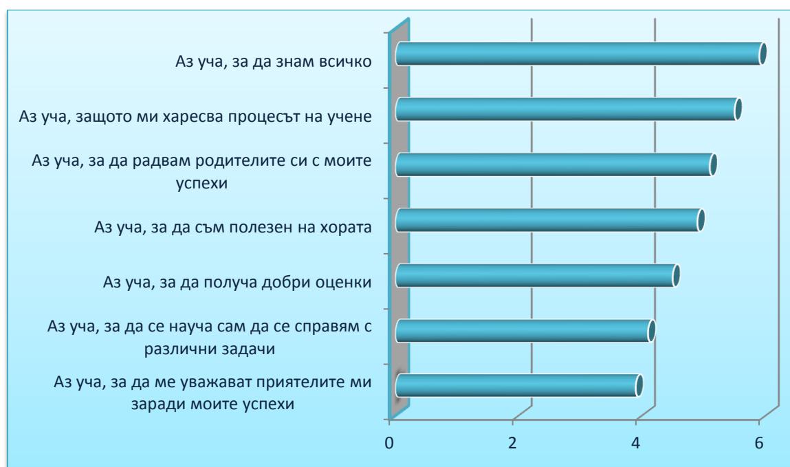
Фигура 2. Йерархична скала на мотивите от проведения тест „Мотивационна стълбица”

Резултатите от проведената методика дадоха възможност да се направи йерархична скала, определяща степента на всеки от изследваните мотиви.