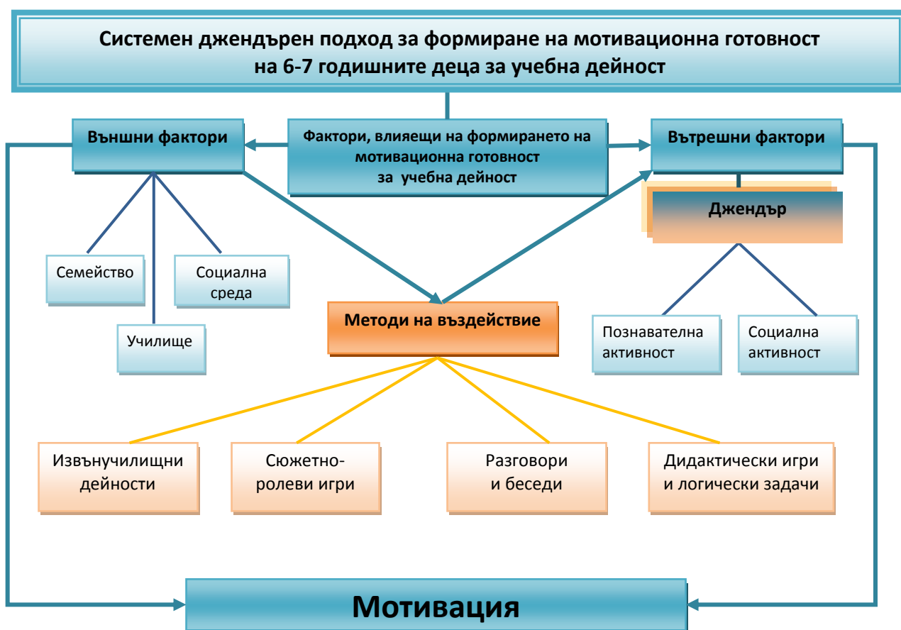
Схема 1. Модел на системен джендърен подход за формиране мотивационна готовност на 6-7-годишните деца за учебна дейност

На базата на анализите от проведените изследвания е разработен модел на системен джендърен подход за формиране на мотивационна готовност за учебна дейност (схема 1), при който се отчитат взаимовръзките между външните и вътрешните фактори, влияещи на формирането на мотивационна готовност и се отделя джендъра като основен предиктор, определящ познавателната и социалната активност при децата.