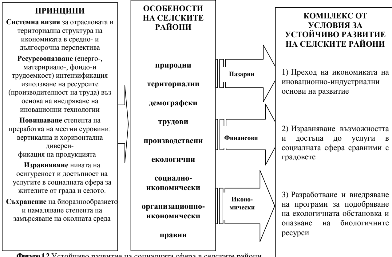
Фигура 12. Устойчиво развитие на социалната сфера в селските райони